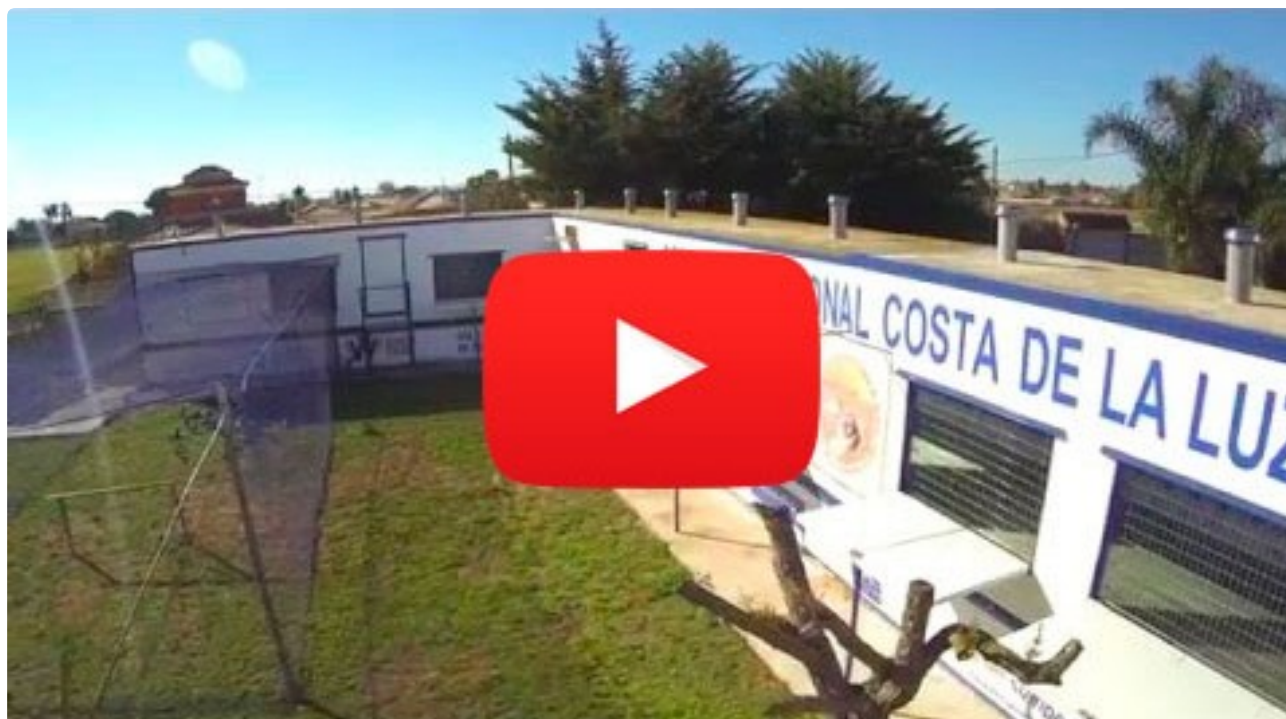
( http://www.derbycostadelaluz.com/video-derby-costa-la-luz.html )